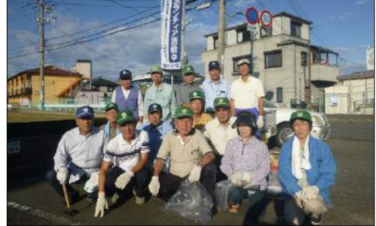
新安松班(新安松町外周歩道)