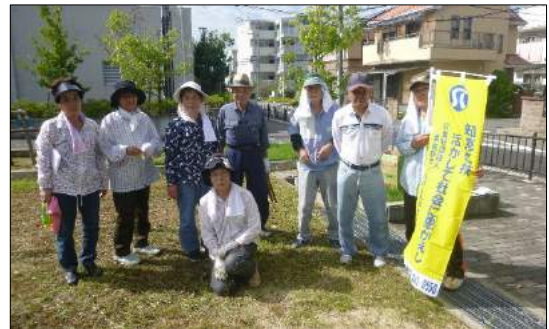
佐野台住宅1・2班(佐野台住宅11棟前公園)