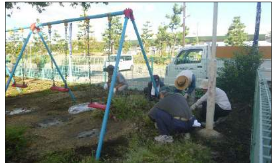
西部1班(本町第1児童公園)