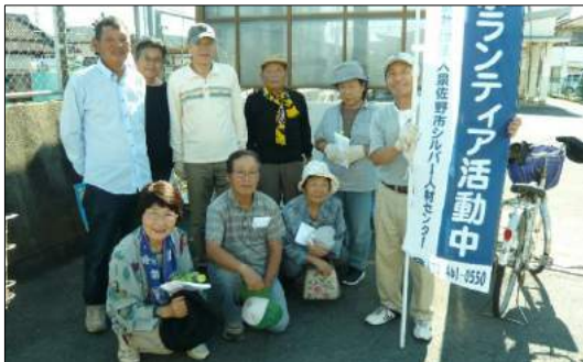
下瓦屋班(南海井原里駅周辺)