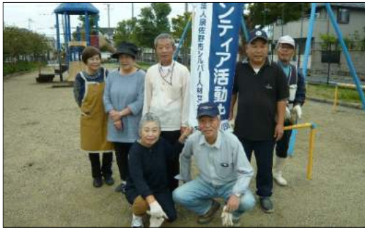
高松1班(末広住宅内コミュニティ広場)