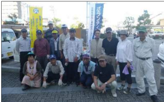
日根野1・2・3班、土丸班(JR日根野駅周辺)

毎年10月のシルバー人材センター事業普及啓発促進月間に地域班による清掃ボランティア活動が行われています。参加された皆様ありがとうございました。（今号は10月11日までに活動された写真を掲載しています）