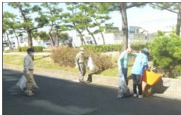
10月4日(月)松原班(松原町会館周辺) 参加された皆様ありがとうございました