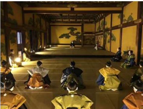
(二条城:二の丸御殿)