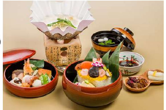
(京料理盛り込み膳)